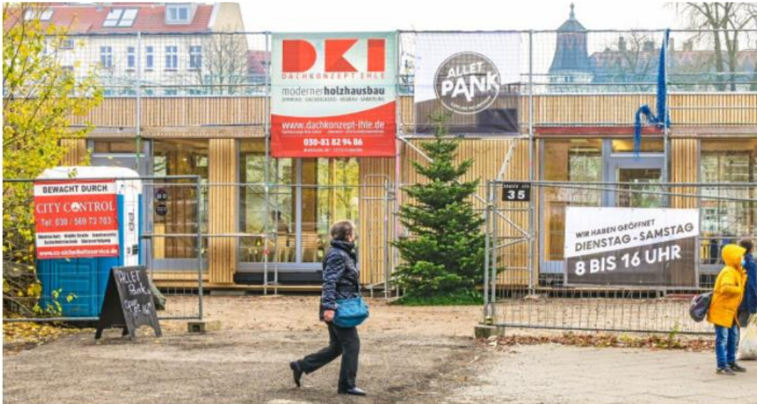
Der Pavillon auf Pankows bekanntester Brache trägt den Namen „Allet Pank“.